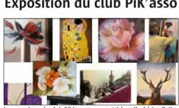
Les membres du club PiK'asso exposent à la salle Adrien Zeller de Sigolsheim, les 16 et 17 mars.