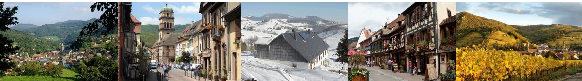
Schéma de Cohérence Territoriale